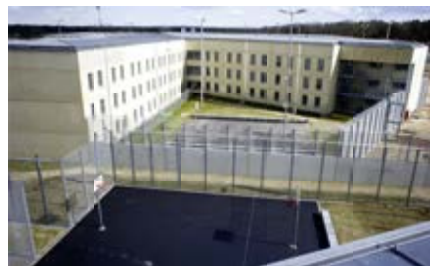
Hafthaus mit Freizeithof

so auf die unterschiedlichen Erfordernisse und Bedürfnisse mit entsprechenden Behandlungsangeboten bestmöglich eingehen zu können.