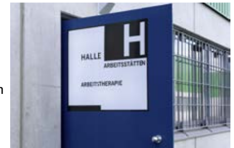
Eingang zur Arbeitstherapie

Der Landesbetrieb für Beschäftigung und Bildung der Gefangenen hat in der JVA Burg eine Niederlassung eingerichtet, in der die Gefangenen beschäftigt werden. Arbeitsplätze stehen aber auch in den Bereichen Versorgung, Reinigung und Landschafts- und Objektpflege zur Verfügung.