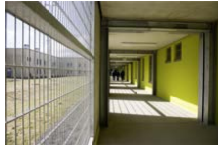
Magistrale entlang der Hafthäuser

Unterbringung von männlichen Untersuchungsfangenen und Verurteilten mit einer Vollzugsdauer von mindestens zwei Jahren und sechs Monaten. Außerdem werden hier Verurteilte untergebracht, gegen die Sicherungsverwahrung zu vollziehen ist. Der Vollzug der Sicherungsverwahrung erfolgt in der für die Unterbringung und Behandlung eigens auf dem Gelände der JVA Burg errichteten und ausgestatteten Einrichtung. Die Abteilung des offenen Vollzuges der JVA Burg befindet sich in Magdeburg und verfügt über 50 Haftplätze.